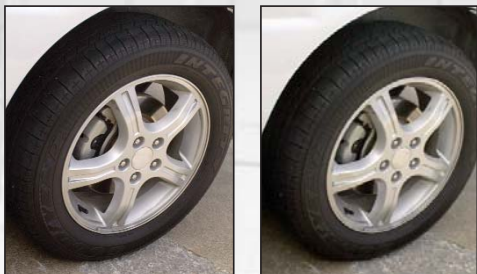
Inflado en un 70% Inflado en un 100% Puede ser muy difícil reconocer un neumático bajo en presión de aire.