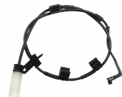
Mini Cooper PWS184