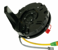
Dodge Sprinter CSP131